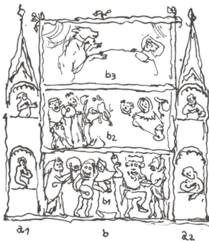
Retablo con un pequeño altar de tres pisos.