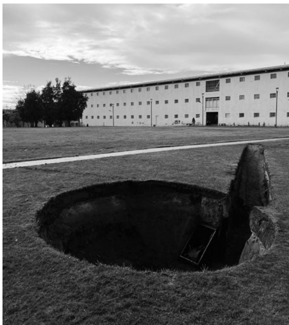
Excavación en el patio del Centro Cultural de Valparaíso.