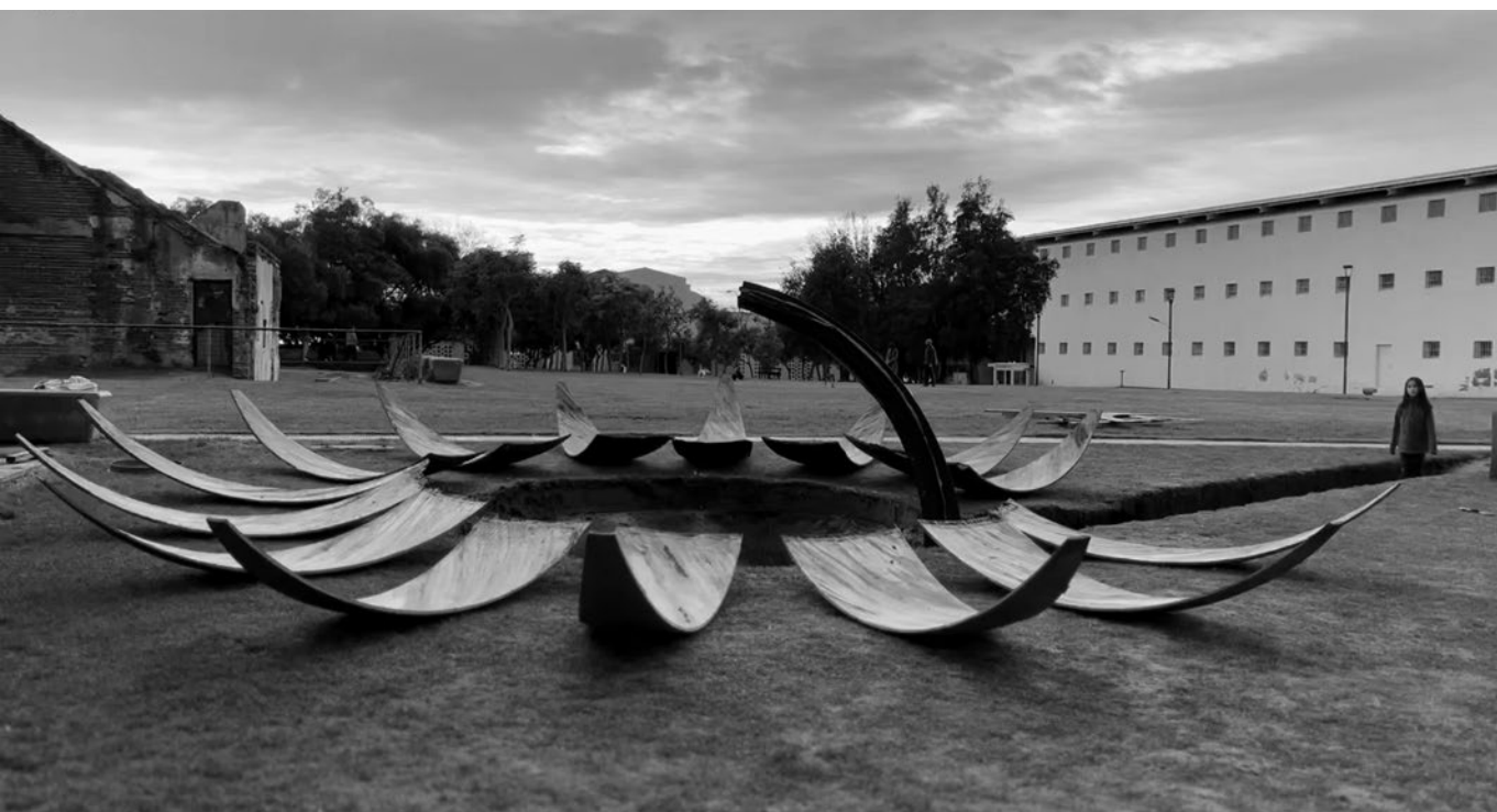
Desarme de la obra.