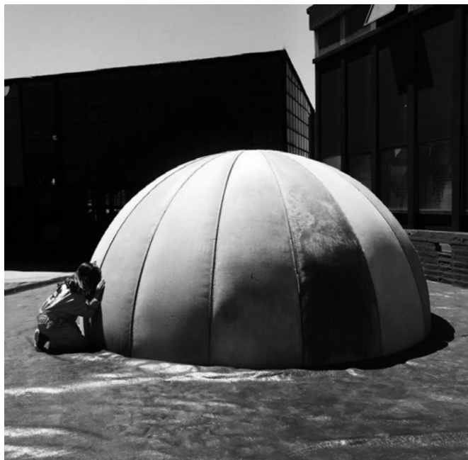
Instalación de la obra, media esfera.